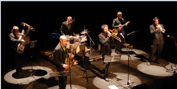
Stromboli Jazz Band